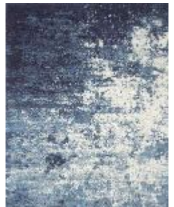
■ R86902X • Slate blue