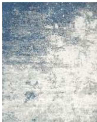
■ R86903X • Sky