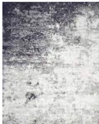
■ R86905X • Slate grey