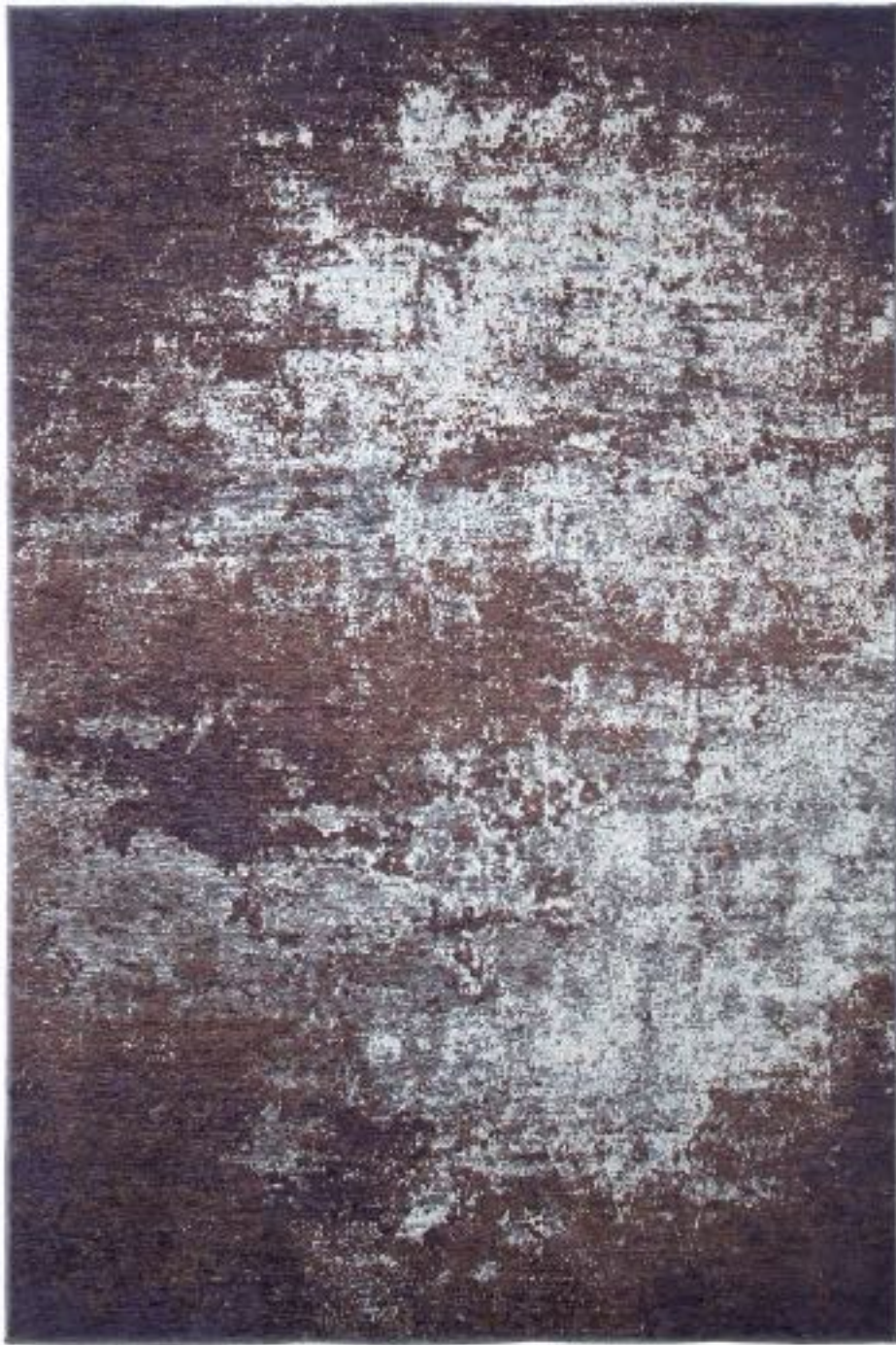
■ R86904X • Aubergine 200 x 300 cm / 79 x 118 in