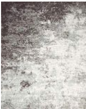
■ R86901X • Coffee